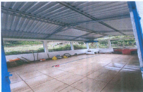
Foto 3: Mejoramiento de losa (tipo torta) e instalación de piso cerámico