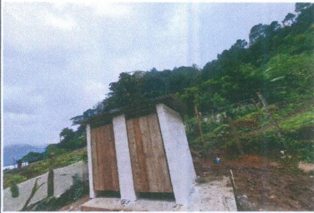
Foto1: Mejoramiento del área de sanitarios (trabajo adicional)