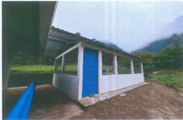
Foto1: Mejoramiento de estructura tipo pórtico